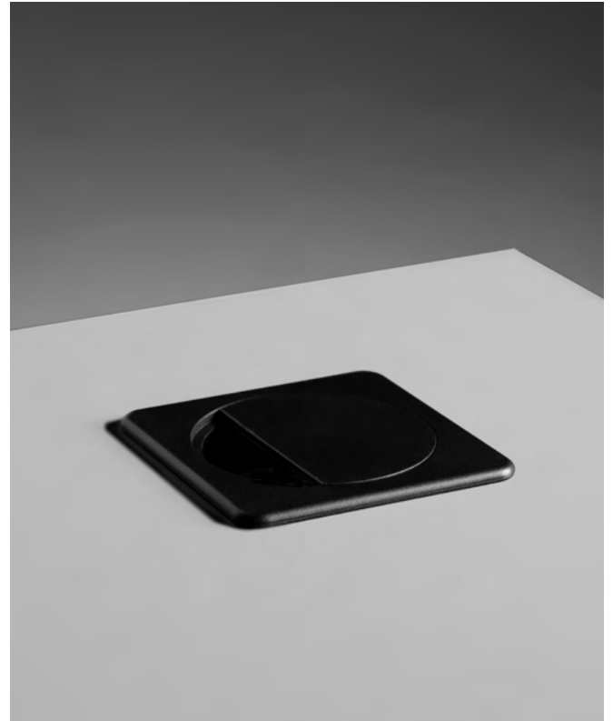
Grommets and media ports

Blat z płyty wiórowej dwustronnie melaminowanej (MFC) z 2mm obrzeżem