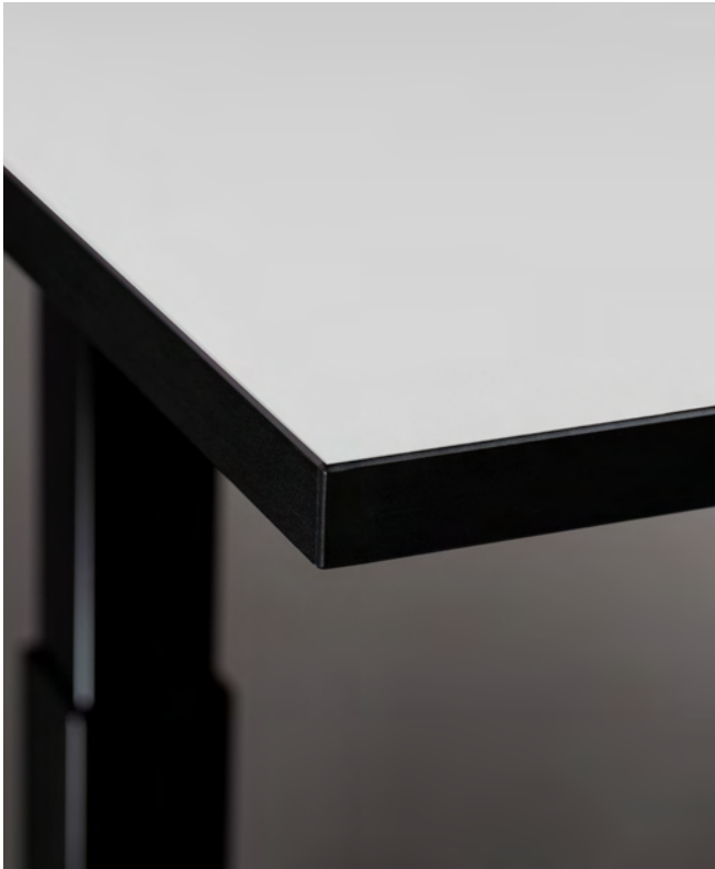
Table top made of melamine faced chipboard (MFC), with 2mm edge

Blat z płyty wiórowej dwustronnie melaminowanej (MFC) z 2mm obrzeżem